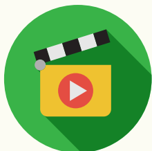
Career KOL 短片