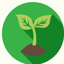
管理培訓生及實習計劃